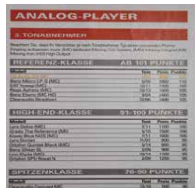
AUDIO 誌では 120 ポイントを獲得

DS001 を発売した後に「世界一のカートリッジ」を作ろうと開発をスタートした W1(World number1) が実際に世界一の評価をいただけたこと DS Audio 一同非常に光栄に思っております。