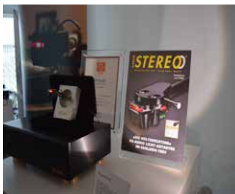
ミュンヘンでの展示の様子

DS-W1 はこちらのレビューでも、120 ポイントと同誌至上歴代最高評価（過去の最高ポイントは 110 ポイント）を獲得致しました。