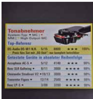
STEREO 誌では 100% の評価